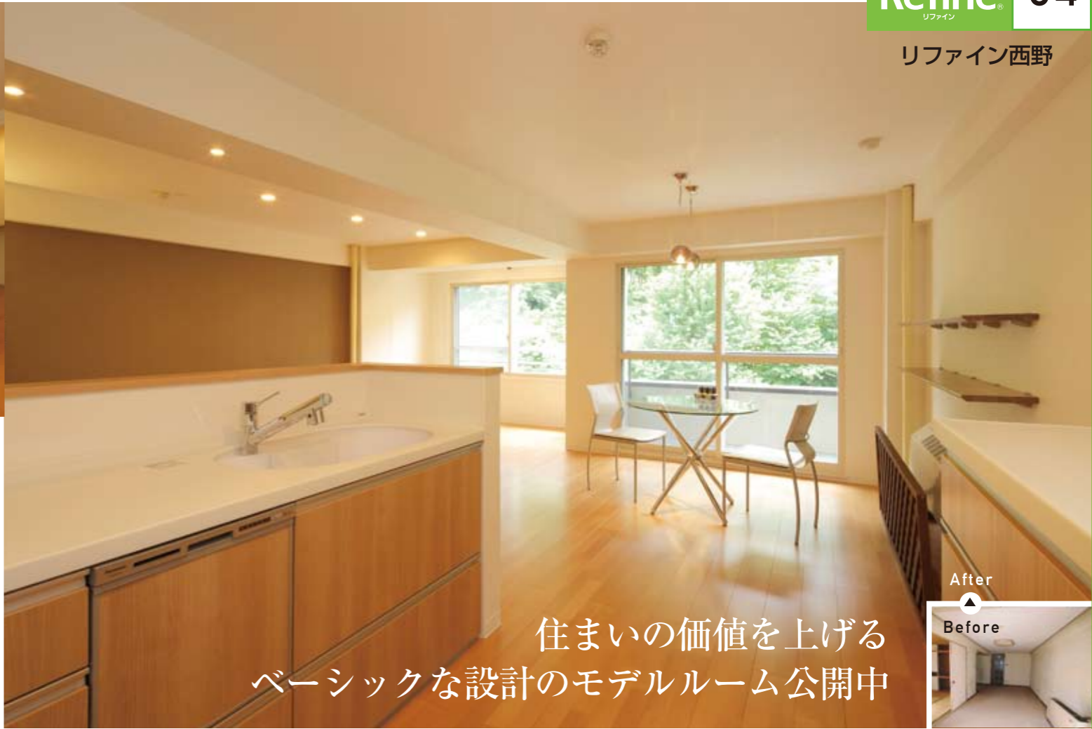
モデルルーム 札幌市中央区宮の森4条11丁目20-2 宮の森ハイツ

空間が細かく仕切られ、部屋数はあっても窮屈な間取り。洗濯機のあるユーティリティが離れ、家事動線も分断。