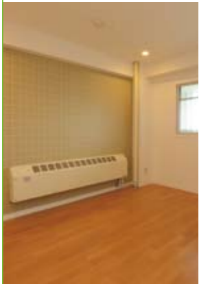
寝室は落ち着いたアースカラー系のクロスで。

これらの改修費用は50万円以下。予算の目安を確かめるため、実際の現場であるモデルルームを活用するのもおすすめです。見学は水曜以外の日時に随時受け付け中。事前に電話でご予約ください。