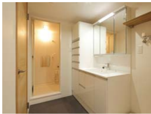
水回りを1カ所にまとめたユーティリティで、使い勝手は格段に向上。